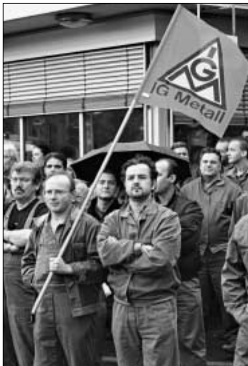
Porsche Protest-Kundgebung in Zuffenhausen

IG Metall Waiblingen Fronackerstraße 60 71332 Waiblingen Fon 07151/95 26-0 Fax 07151/95 26-22 waiblingen@igmetall.de www.waiblingen.igm.de/