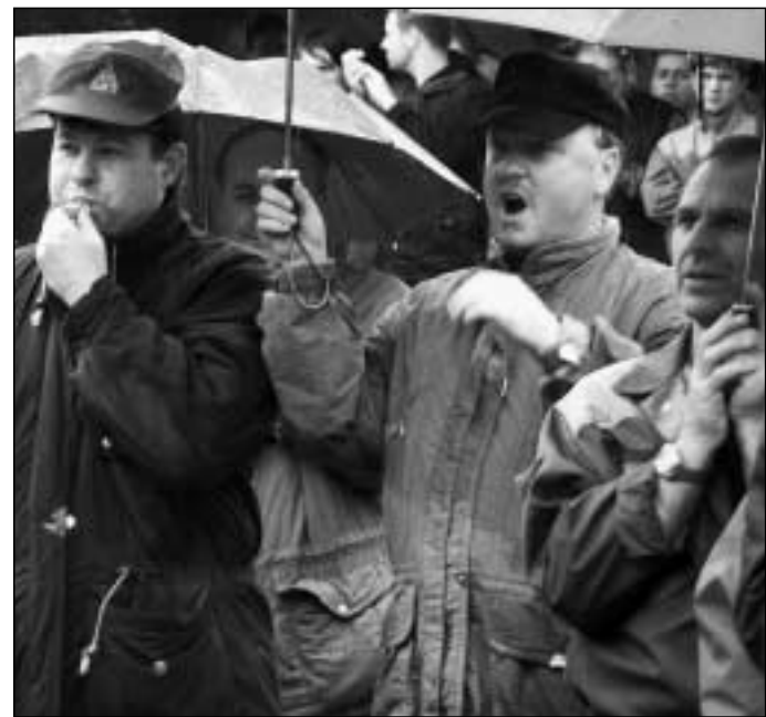
Daimler-Chrysler Protest-Kundgebung in Untertürkheim